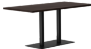
RQ Light t-2002