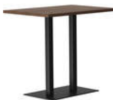
RQ Light t-2008