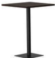
RQ Light t-2006