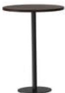
RQ Light t-2007